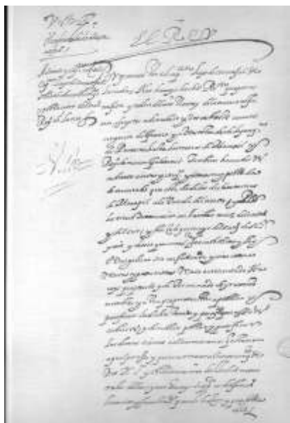
Fig. 2. Las capitulaciones de 1579 [15].

De por vida, y con la prerrogativa de designar a su heredero, Carvajal recibió el cargo de Gobernador y Capitán General con autoridad para descubrir, pacificar y poblar una nueva provincia que se denominó Nuevo Reino de León y que se extendería hasta 200 leguas de latitud y otras tantas de longitud, abarcando su jurisdicción desde el oeste del puerto de Tampico hasta los límites de Nueva Galicia y Nueva Vizcaya y al norte en territorio inexplorado[14]. Sin embargo, ya sea por el desconocimiento geográfico que la corona tuvo de la región, ya sea por la interpretación de la extensión del territorio que hiciera Carvajal, los límites sobrepasaban los ya establecidos de la Nueva Galicia y la Nueva Vizcaya.