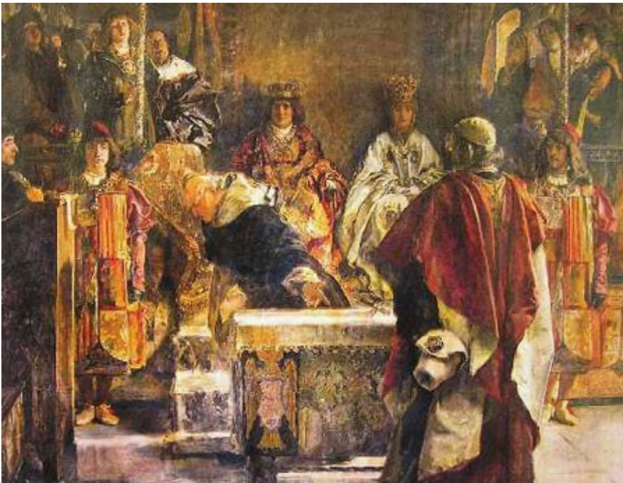
Fray Tomás de Torquemada, Inquisidor General, ofrece el decreto a los Reyes Católicos para su firma

El asunto es que ya en las Cortes de Toledo de 1480 los judíos fueron separados de los cristianos y obligados a vivir en barrios separados o aljamas y también debían de llevar unas redondelas rojas que les identificaba como tales. Sin embargo pudieron conservar sus propias leyes y celebrar sus ceremonias religiosas sin problemas.