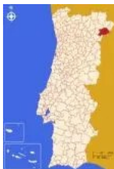
Fig. 1. Mogadouro, en la región de Tras-os-Montes

Justo en la llamada Raya de Portugal, en la villa de Mogadouro provincia de Tras-os-Montes, nació Luis de Carvajal y de la Cueva en 1539, en el seno de una familia de ascendencia judía arraigada en Medina del Campo en la región de Castilla-León.