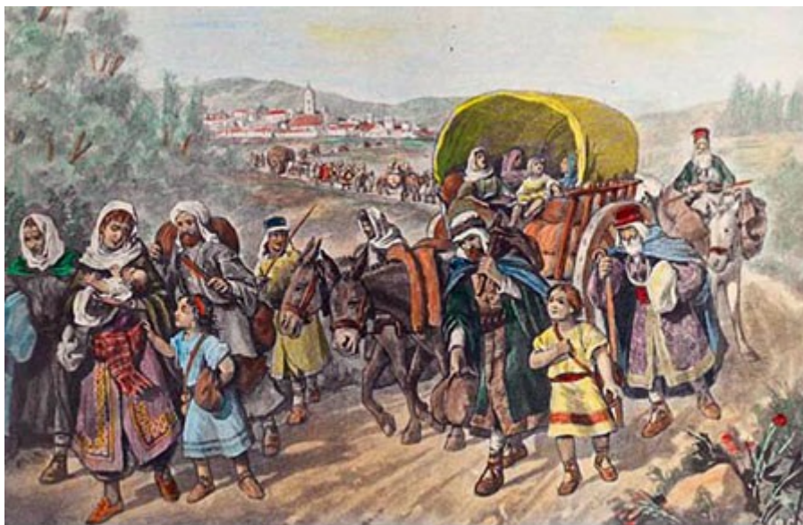
Judíos saliendo de una ciudad castellana

Leyendo el decreto de la Alhambra o Edicto de Granada en su primer párrafo podemos ver la verdadera causa de dicha expulsión: “estamos informados por la Inquisición y otros el gran daño que persiste a los cristianos al relacionarse con los judíos, y a su vez estos judíos tratan de todas maneras a subvertir la Santa Fe Católica y están tratando de obstaculizar cristianos creyentes de acercarse a sus creencias” 7 / 8 . Es decir, el motivo es puramente religioso, se expulsa a los judíos porque según la Inquisición, encargada de vigilar que las conversiones fueran sinceras, éstos trataban de convencer y de revertir la fe de los llamados cristianos nuevos o conversos hacia la fe judaica.