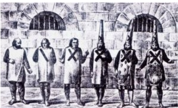
Fig. 4. Las prendas penitenciales de los reos de la Inquisición[34].

En el auto de fe el 24 de febrero de 1590 se quemó la efigie de su padre al tiempo que toda la familia abjuró públicamente de sus prácticas judaicas. La Inquisición confiscó todos sus bienes y se les dio penitencia espiritual que consistía en ayunar los viernes, rezar el rosario de cinco misterios los domingos y días de fiesta y usar el sambenito[33].