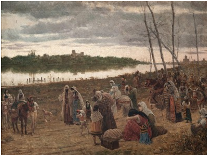
La expulsión de los judíos de Sevilla, de Joaquín Turina y Areal

La expulsión de los judíos de los territorios de Castilla y Aragón, en 1492, es uno de los asuntos más debatidos entre los que sucedieron a lo largo del reinado de los Reyes Católicos. Ante todo, es importante señalar que no se trató de un hecho que fuera único o exclusivo de la monarquía hispánica. Ciertamente, a lo largo de la Edad Media, esta comunidad religiosa ya sufrió la expulsión en otros Estados. Sin