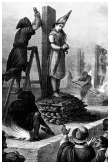
Fig. 5. El suplicio de Mariana de Carvajal [43]

Como penitentes participaron su hermana Ana y su sobrina Leonor de Cáceres. En 1649 Ana también sería procesada y muerta.