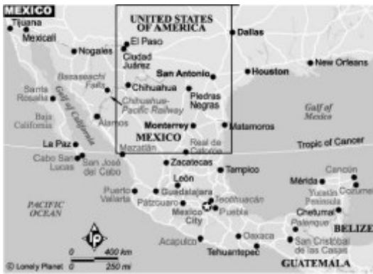
Fig. 3. Uno de los mapas con los límites del “Cuadrado de Carvajal”[19].